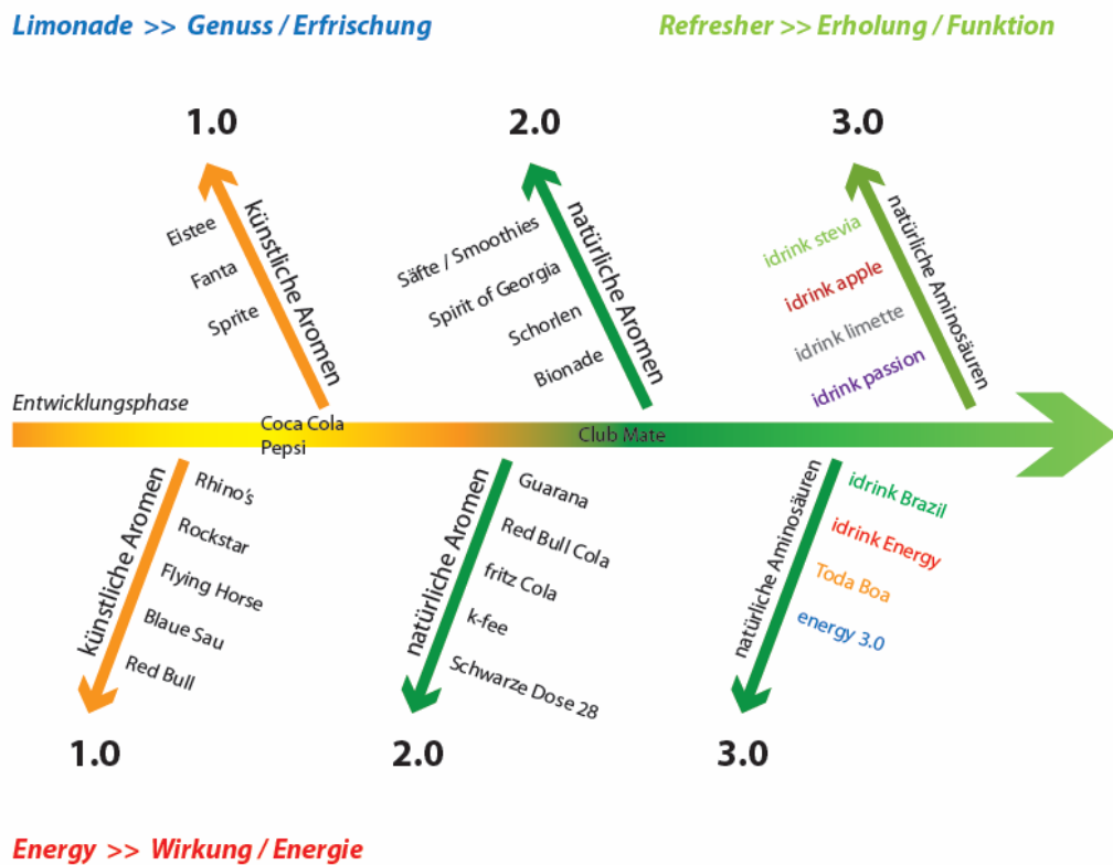
Schaubild der Entwicklung der Getränke:

Die Geschichte der Getränkeentwicklung von vor 100 Jahren bis heute stellt die Weiterentwicklung zur nächsten Getränkengeneration Level 3.0 deutlich dar. Die Konsumenten erwarten neue innovative Getränke, die mit der Zeit gehen und einen erheblichen Mehrwert bieten.